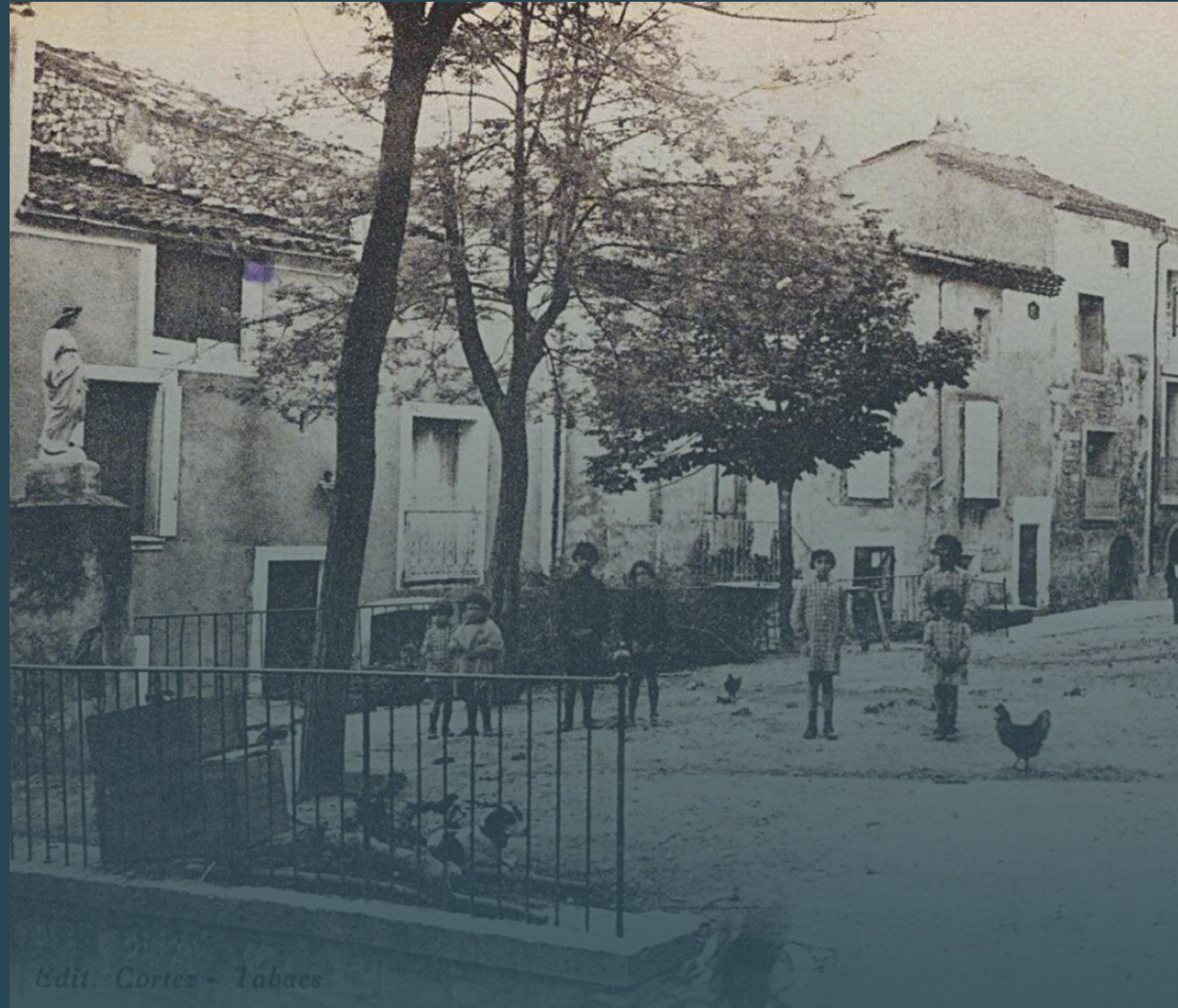
Carte postale